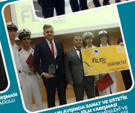
AHİLİK ANLAYIŞINDA SANAT VE ESTETİK KONUSU KISA FİLM YARIŞMASI 1.Sİ MERSİN TİCARET ODASI MESLEKİ VE TEKNİK ANADOLU LİSESİ ÖĞRENCİLERİ